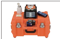
带工作台的收纳箱 CC-82