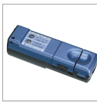
多芯光纤用剥线钳 JR-6