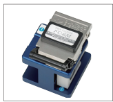
光纤切割刀 FC-6 / FC-6R 系列