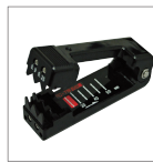
单芯/2芯光纤用剥线钳 JR-25