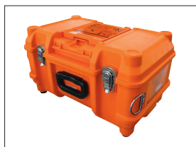
带工作台的收容箱 CC-600