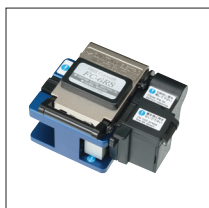
光纤切割刀 FC-6 / FC-6R 系列