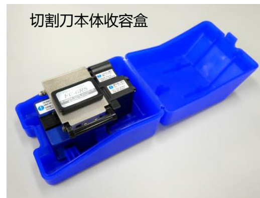
切割刀本体收容盒